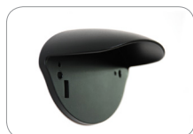
WC_HR50 Pokrywa dla czujnika HR50